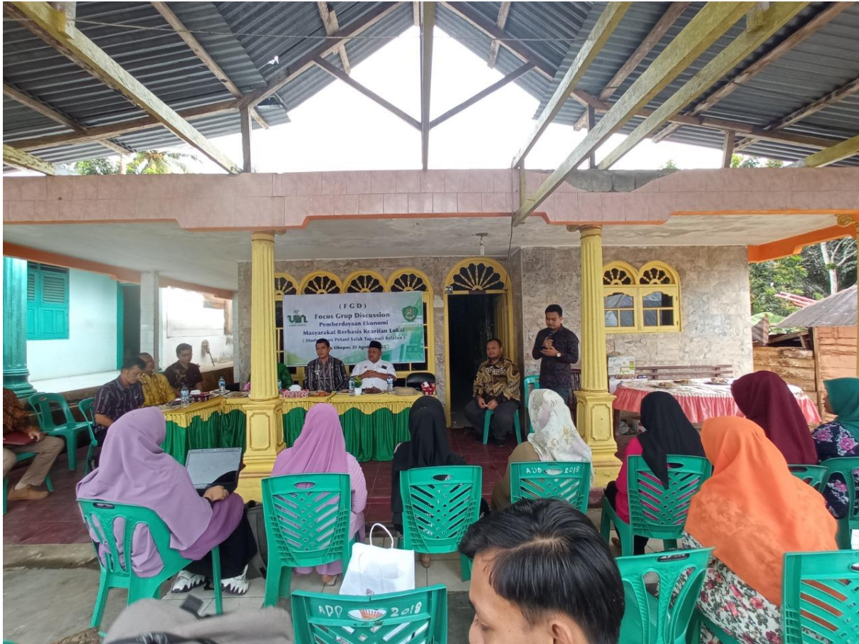
Gambar 17. Kegiatan Pengabdian Masyarakat Program Studi Ekonomi Islam Fakultas Ekonomi dan Bisnis Islam Universitas Islam Negeri Sumatera Utara Medan dilaksanakan di Desa Sihopur, Kec. Angkola Selatan, Kab. Tapanuli Selatan, 25 Agustus 2022.