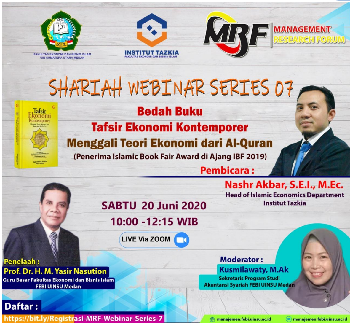
Gambar 6. Manajemen Research Forum mengadakan webinar Bedah Buku Tafsir Ekonomi Kontemporer Menggali Teori Ekonomi dari Al-Quran, 20 Juni 2020