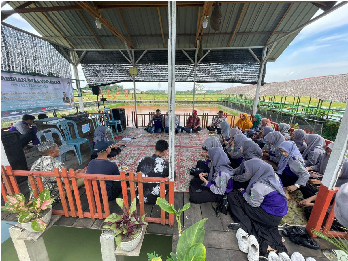
Gambar 18. Kegiatan Pengabdian Masyarakat Program Studi Ekonomi Islam Fakultas Ekonomi dan Bisnis Islam Universitas Islam Negeri Sumatera Utara Medan dilaksanakan di Desa Punden Rejo Kec. Tanjung Morawa Kab. Deli Serdang, Sabtu tanggal 10 September 2022.