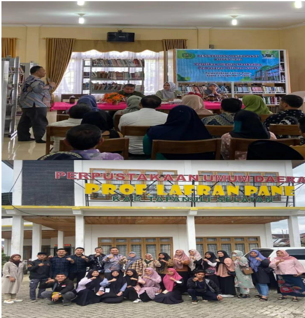
Gambar 19. Kegiatan Pengabdian Masyarakat Program Studi Ekonomi Islam Fakultas Ekonomi dan Bisnis Islam Universitas Islam Negeri Sumatera Utara Medan dilaksanakan di Perpustakaan Daerah Lafran Pane, Pangurabaan Kec. Sipirok Kab. Tapanuli Selatan, Sabtu 17 September 2022.