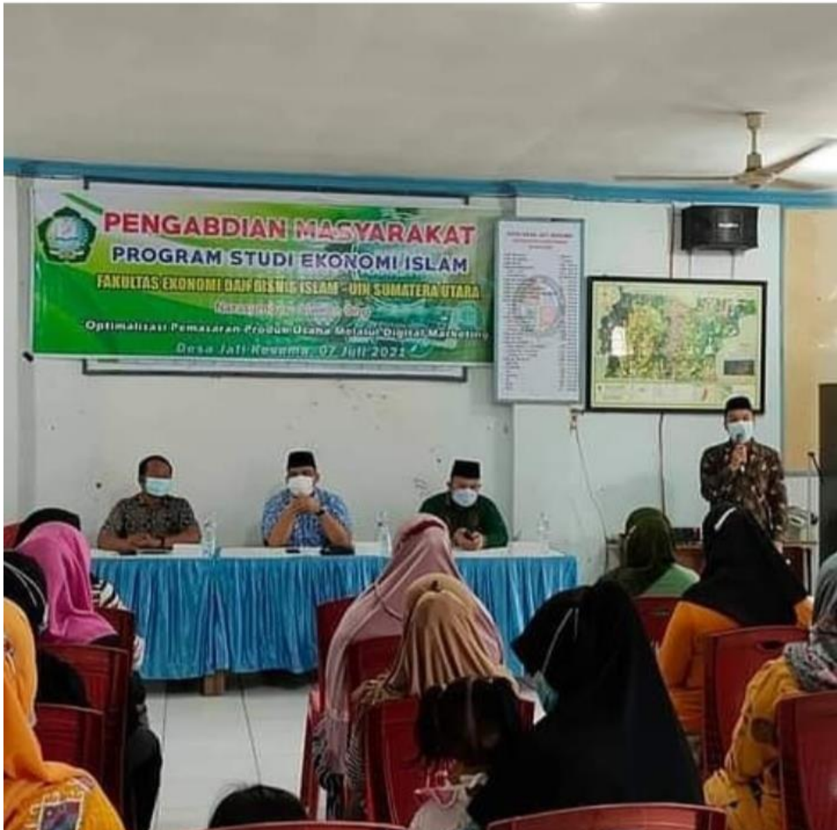
Gambar 16. Kegiatan Pengabdian Masyarakat Program Studi Ekonomi Islam Fakultas Ekonomi dan Bisnis Islam Universitas Islam Negeri Sumatera Utara Medan dilaksanakan di Desa Jati Kesuma Kec. Namorambe, Kab. Deli Serdang, Rabu tanggal 7 Juli 2021.