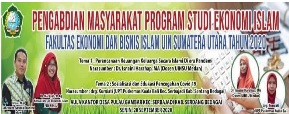
Gambar 12. Spanduk Pengabdian Masyarakat Prodi Ekonomi Islam