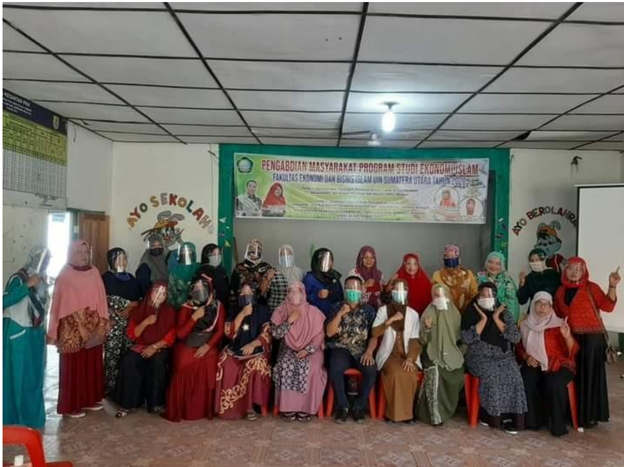
Gambar 11. Foto Bersama Peserta Ibu PKK dengan Narasumber