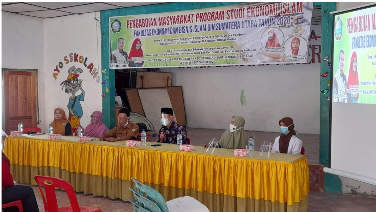
Gambar 4. Pembukaan Kegiatan oleh Bapak Dekan FEBI