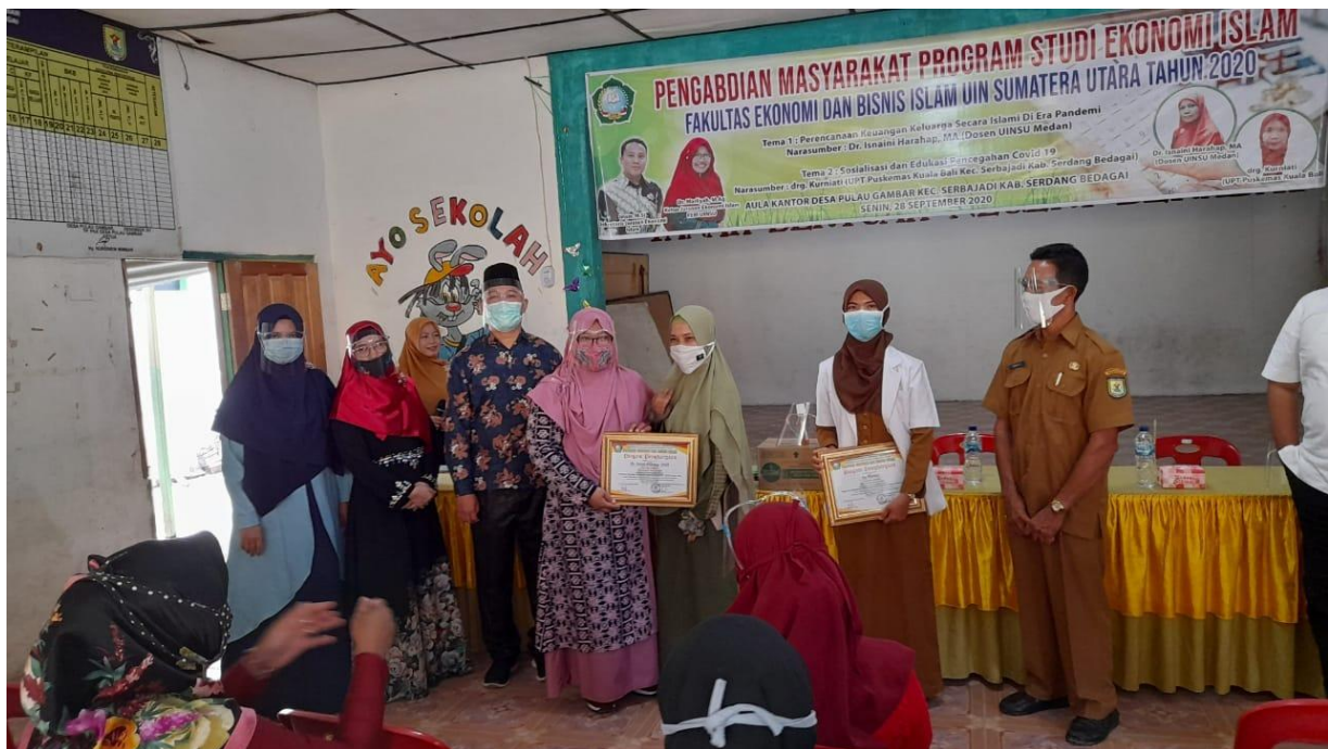
Gambar 7. Penyerahan Piagam Penghargaan Kepada Narasumber