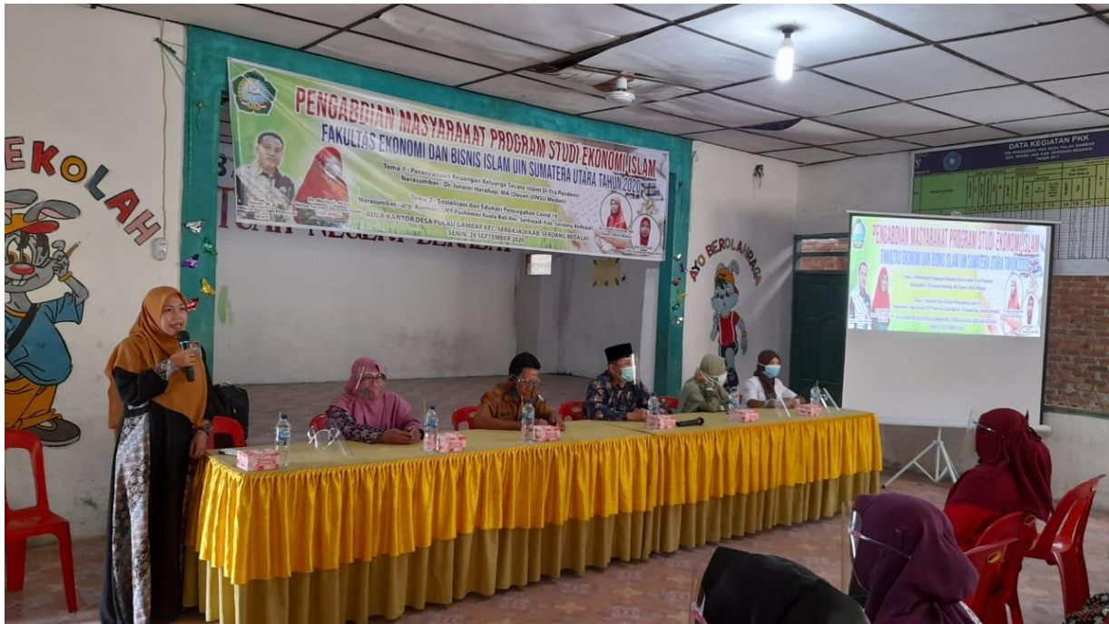
Gambar 1. Opening Ceremony oleh MC