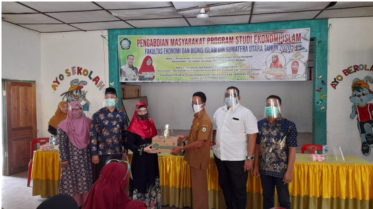
Gambar 6. Penyerahan Masker dan Sabun Cair Ke Kepala Desa