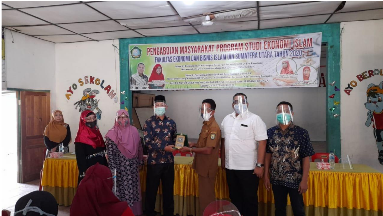
Gambar 5. Penyerahan Plakat ke Kepala Desa Oleh Bapak Dekan FEBI