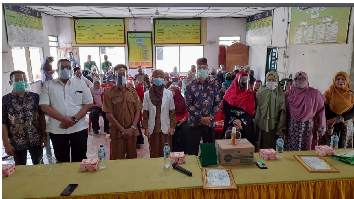
Gambar 8. Foto Bersama dengan Peserta